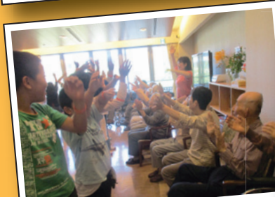
利用者様方と 小学校の児童さんたちとのハイタッチ!!