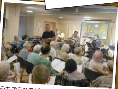
うたごえひろばは、 元気な声と笑顔でいっぱいです。