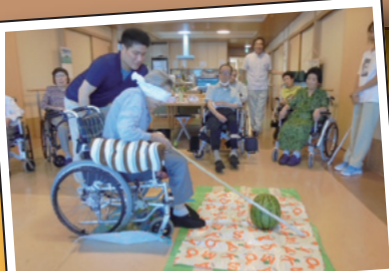
すいか割 もうちょっとでした。惜しい…