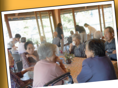
カフェ 八角堂にて 楽しくおしゃべり中♠♦♣♥