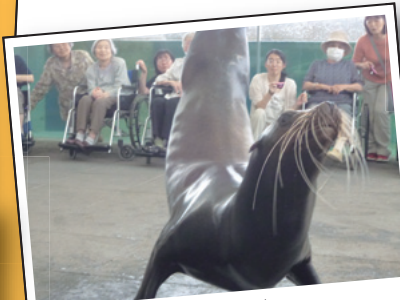
あしかさんのお出迎えです。