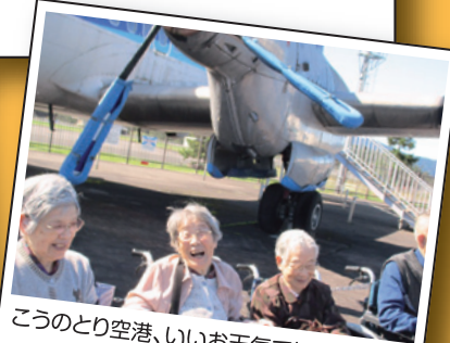
こうのとり空港、いいお天気でした。