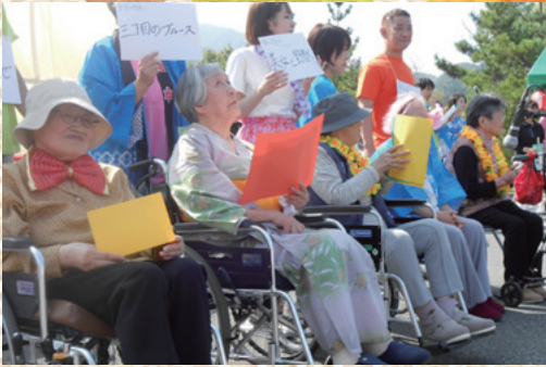
たのしい、たのしい 戸歌合戦!