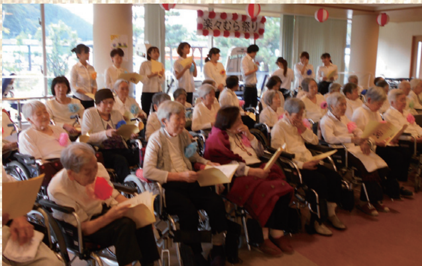
みんなでいっしょに歌いましょう戸