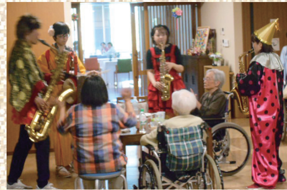
どこへ行っても人気者のチンドン屋さん