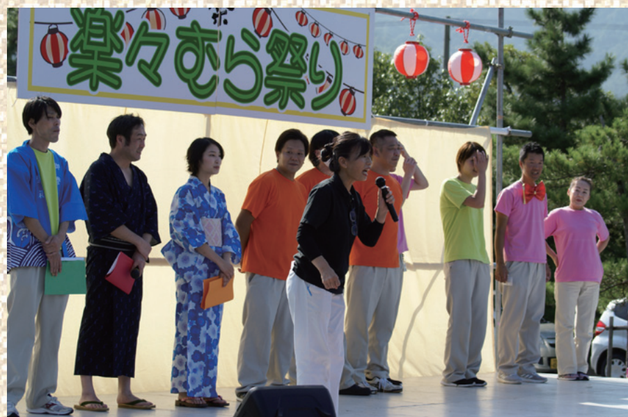
施設長による閉会宣言。大盛況のうちに幕を閉じました。