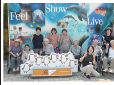
城崎マリンワールドで記念写真♡