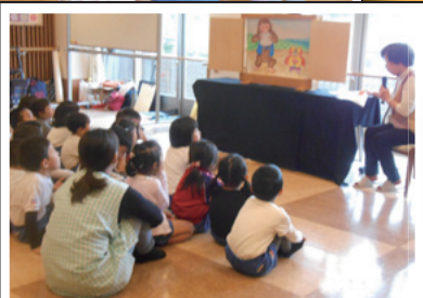
こども園のみんなに たくさんの元気をもらいました。