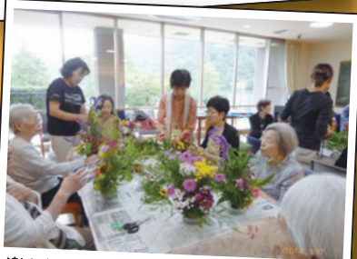
楽々むら祭りに出展する お花を生けてます。