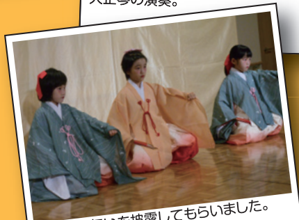
かわいい舞いを披露してもらいました。