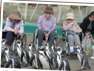
ペンギンさんのおさんぽ。