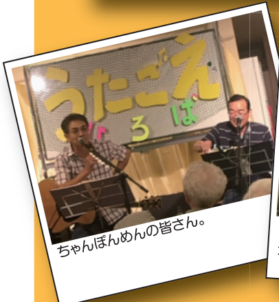
ちゃんぽんめんの皆さん。